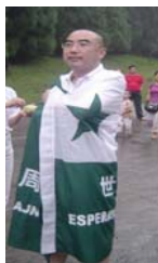
s-ro Long Lu

ni ja ne forgesos pri viaj konstru' kaj kontribu' al l' E-movado sen sku'