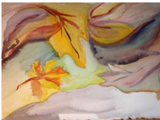
Ilustraĵo de la aŭtorino

Ĉiuj vivas sed transiras al alia form', alia norm'. Eterna estas vivo, sen komenco, sen fino. Prizorgas nin dio aŭ diino!