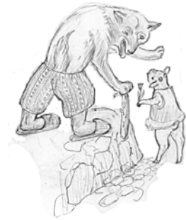
Ilustraĵo de Tatjana Ĥomjakova

La ŝafid’ nun diras pete: “Se vi lupreg’ permesas, mi ja trinkos kviete for de vi prete