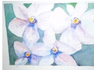
Pentraĵo de la aŭtorino

Fremda certe ne la sent' en iu land' en mondo alparol' amika tent' al sama lingva fonto. Foriĝas do la ni kaj vi ni ĉiuj estos ni kaj veras nia utopi'.