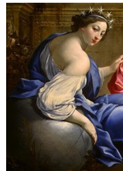
Juiz de Fora, 12/06/2015.

Kaj salutas li la Forton, kiu subtenas kaj movas ĉiujn sunojn en la kosmo; Ĝi, kiu estas la sama flamo, kiu animas lian korpon dum pilgrimanta iro!