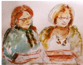
penetraĵo de la aŭtorino

En teatro oni ilin trovas, post sidante en kafejoj. Ankaŭ pri genepoj povas ili zorgi, gardante en ludejoj.