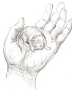
Ilustraĵo de Tatjana Ĥomjakova

Kaj post du jaroj okazis ĉefaj eventoj. Ĉe Pusjka naskiĝis du ĉarmaj katidoj! Jes, ĝuste post du jaroj post apero de Pusjka en nia hejmo panjo helpis al ŝi naski du katidojn. Ĉio okazis en tiu tempo, kiam mi estis en lernejo. Al mia reveno al hejmo en skatoletoree inter lito kaj ŝranko kuŝis laca kaj fiera mia amatino, kaj du malgrandaj buletoj alpremiĝinte al ŝia ventro trankvile dormis. Unu katido estis precize kiel panjo antaŭ du jaroj, sed alia katido estis nigra kun blankaj piedoj kaj brustumo.