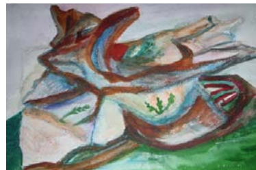
penetraĵo de la aŭtorino

Post 80 minutoj, memoro estas for nur nombroj restis en la kor'.